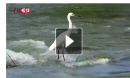
千只白鹭与鸬鹚翩跹共舞