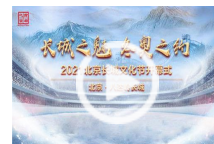
“长城之魅 冬奥之约”——2021北京长城文化节开幕式