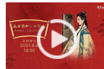
国家大剧院：京剧遇古筝，霸王别虞姬