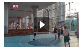
成都立交桥下的一公里运动场