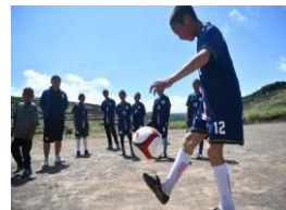
“云端小学”的第一课