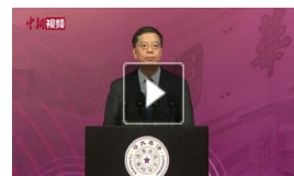
清华大学校长：让生命之光更加明亮