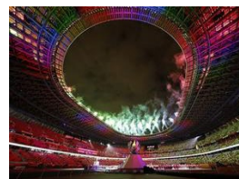
东京残奥会闭幕式举行