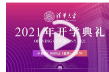
清华大学2021年研究生开学典礼