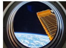
“神摄手”作品震撼发