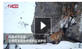
赤狐现身海拔4200米雪地