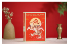
【新品】 故宫日历2022虎年新版 内附AR文物手账本