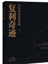
【新书】 复利奇迹 理财小白从容面对投资人生