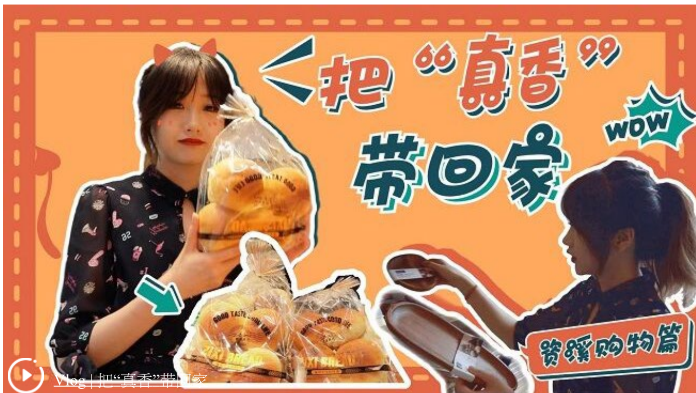
Vlog | 把“真香”带回家