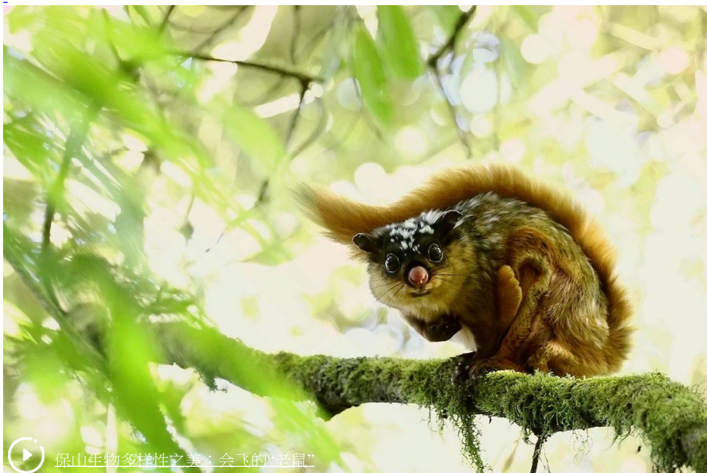
保山生物多样性之美：会飞的“老鼠”

Copyright © 2000 - 2021 XINHUANET.com All Rights Reserved.