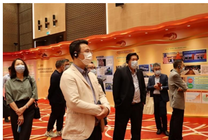
會員細心聆聽導賞員講解，細覽珍貴圖片