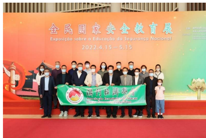
澳門經濟學會參觀“全民國家安全教育展”

本會表示，未來將一如既往地堅定維護國家安全，並緊扣新時代下國家構建新發展格局的總體要求，在澳門更好融入國家發展大局，全面助力“一帶一路”建設和參與粵港澳大灣區建設中，繼續貢獻智慧、建言獻策，為澳門經濟社會的可持續發展發揮積極的智庫作用。