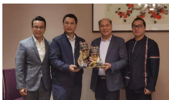
本會會晤佛山-澳門經濟文化促進會考察團